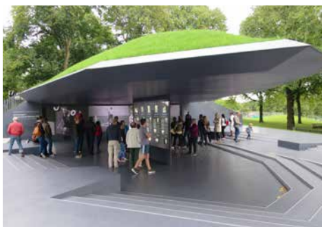
Erinnerungsort Olympia-Attentat München 1972 Foto: Christian Horn, Horn Color, 2017