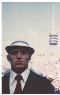
Mark Slavin beim Einzug ins Olympiastadion, München 1972

Mark Slavin wird im sowjetischen Minsk geboren. Er wächst privilegiert auf, da sich sein Großvater im Zweiten Weltkrieg in der Roten Armee ausgezeichnet hat. An einer Sport-Eliteschule wird er zum Ringer ausgebildet. 1971 ist er Juniorenmeister der Sowjetunion. Trotz seiner sportlichen Erfolge leidet Slavin zunehmend unter dem herrschenden Antisemitismus. Er überzeugt seine Familie gemeinsam mit ihm nach Israel zu emigrieren. Drei Monate vor den Olympischen Spielen 1972 gelingt die Ausreise. Er wird sofort eingebürgert, so dass er mit dem israelischen Team nach München fahren kann.